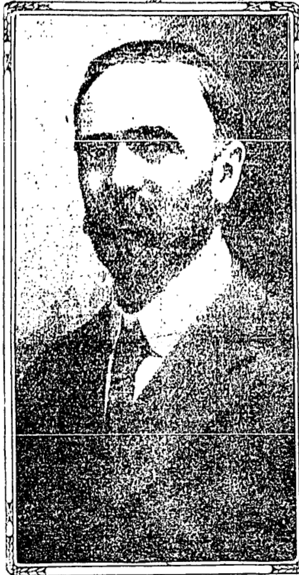
SR. FRANCISCO I. MADERO. ULTIMO RETRATO

CUANDO SE LES TRANSLADABA A ESA PRISION, EN DOS AUTOMOVILES, UN GRUPO DE HOMBRES ARMADOS PRETENDIO LIBERTARLOS RESULTANDO MUERTOS, DE RESULTAS DEL TIROTEO ENTABLADO ENTRE ASALTANTES Y ESCOLTA, DOS DE LOS PRIMEROS Y LOS DOS PRESOS.—DECLARACIONES DEL PRESIDENTE GRAL. HUERTA