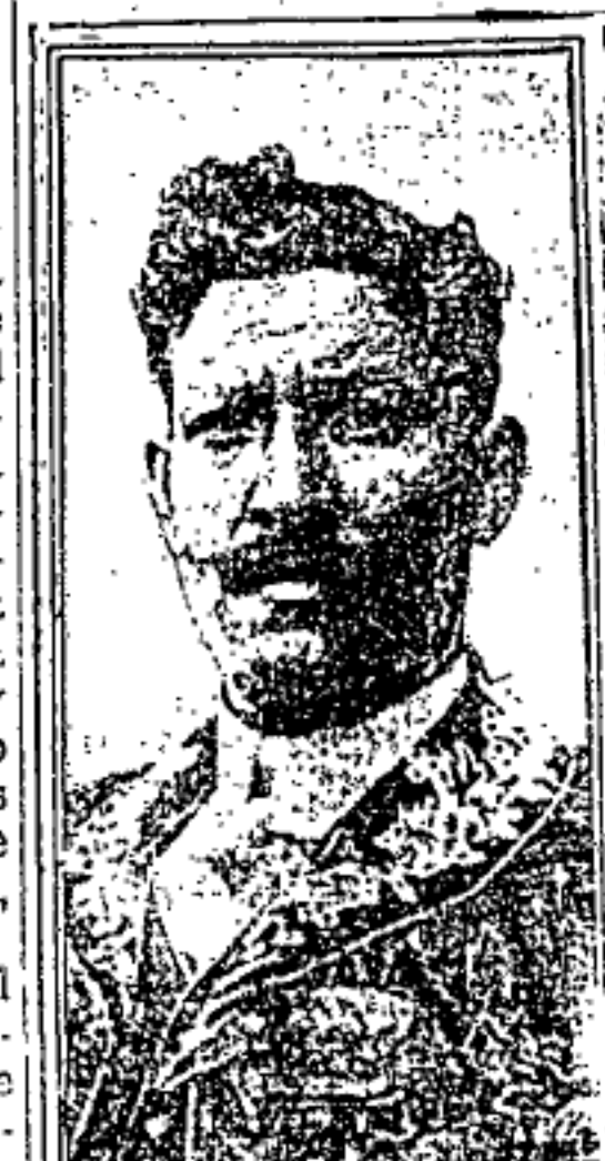
MAYOR DEL PR. DE FUERZAS ARMADAS, GENERAL DON ERNESTO MADERO

CAIRO, Egipto, Febrero 22. El General Porfirio Díaz, ex-prime ministro de la República Mexicana, con respecto a la situación actual del país, que se le pregunta en el momento de su salida de México, dice que su opinión sobre los sucesos ocurridos en México, es que no debe manifestarse ninguna opinión sobre la situación de México. El hallarse alejado de la política le impide hacerlo.