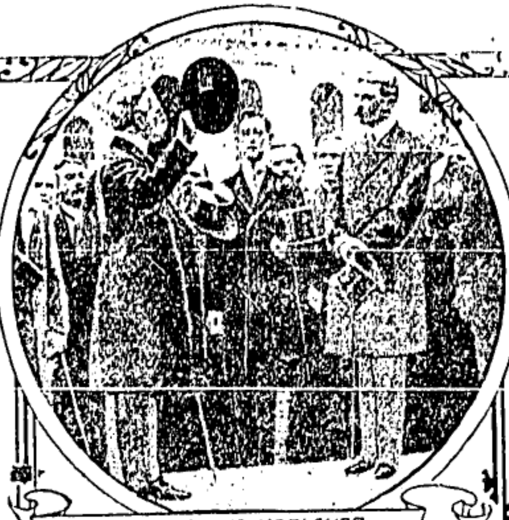
EL SR. DE LA BARRA, HABLANDO.

EL EMBAJADOR WILSON, DESPUES DEL HOMENAJE AL PATRICIO NORTEAMERICANO, DEPOSITO UNA OFRENDA FLORAL EN LA TUMBA DE JUAREZ